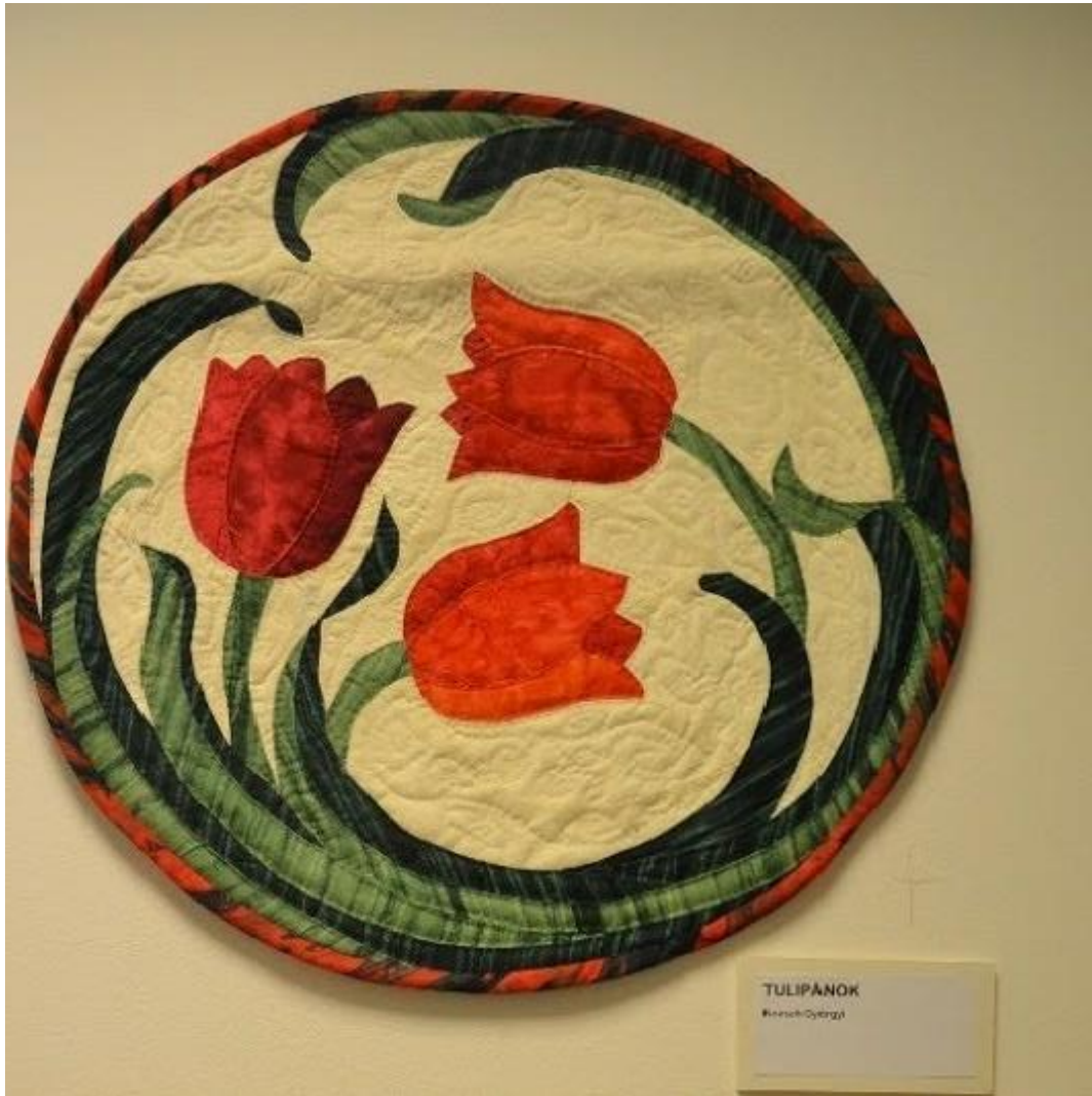
TULIPÁNOK Károly Csizszi