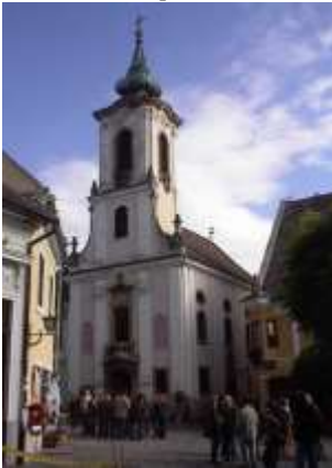
Blagovestenszka (Grecska) templom