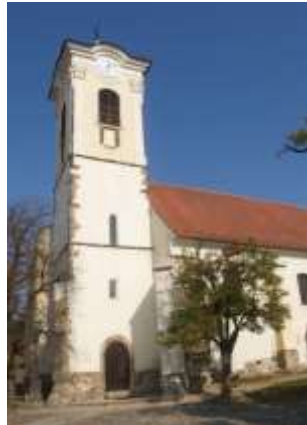
Keresztelő Szent János plébániatemplom