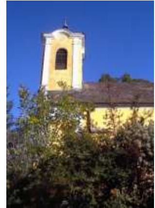
Opovacska (ma református) templom