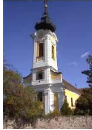
Zbeska (ma Szent András katolikus) templom