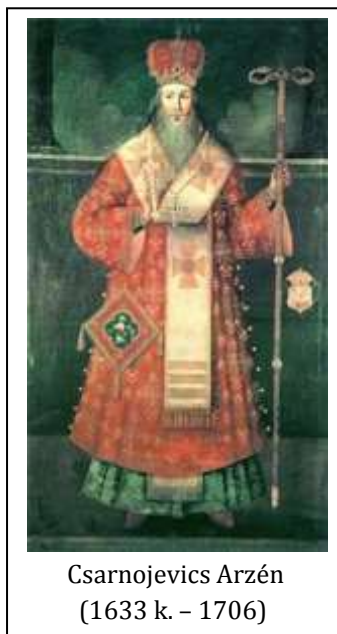
Csarnojevics Arzén (1633 k. – 1706)

1691 áprilisában ifjabb Zichy István, Szentendre akkori földbirtokosa 6000 Szentendrére menekült szerb befogadását említi. Hol és milyen körülmények között vészelhették át – a valamivel kellemesebb, déli éghajlathoz szokott emberek, köztük nők, gyerekek és idősek – ezt az első, bizonyára rettenetes telet egy alig néhány portával és házzal rendelkező, elpusztult faluban? Erről a ma magyar nyelven olvasható források nem beszélnek, de arról igen, hogy szinte azonnal megkezdődött az új házak és az első, még fatemplomok építése.