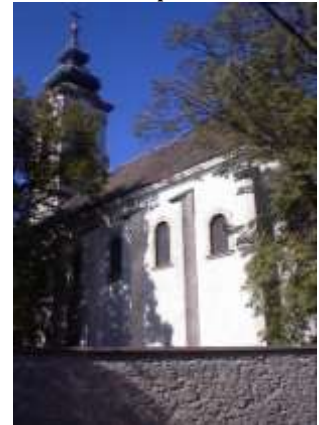
Preobrazsenszka (Tabacska) templom