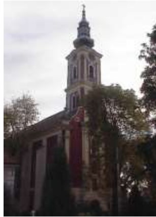
Saborna vagy Beogradska templom