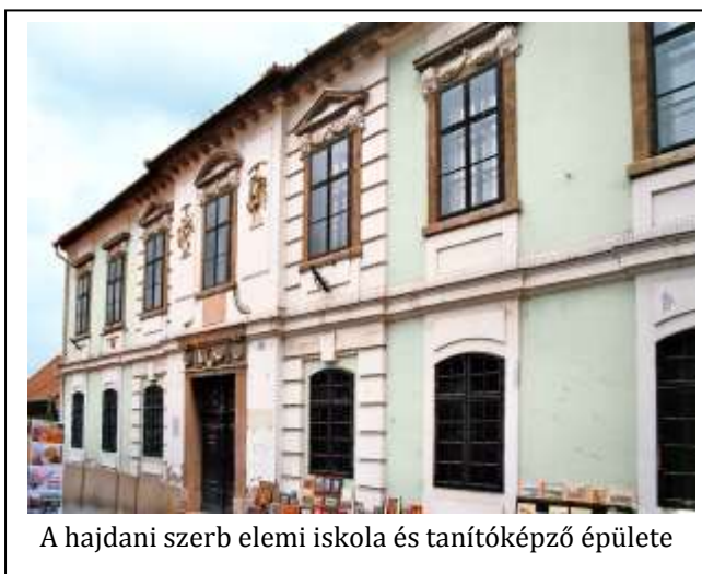
A hajdani szerb elemi iskola és tanítóképző épülete

A szőlőkultúra különös helyi jelentősége miatt a szentendrei szőlősgazdák is céhet alapítottak . A nekik tulajdonított ládát, mely ma a Várostarténeti kiállításban látható, a szamárhégyi dalmátok, a város legszorgosabb szőlőmunkásai használták: ősi szokás szerint ebben voltak a közösség legfontosabb iratai, féltett kincsei. Ők is állítottak céhkeresztet, ez a Bogdányi és a Dézsma utca sarkán ma is áll.