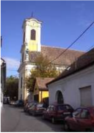
Csiprovacska (ma katolikus Péter-Pál) templom