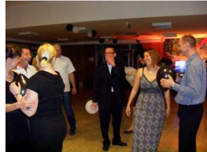
A játék második fordulójában fekete és fehér lufikra tánc közben hímes tojásként kell vigyázni.