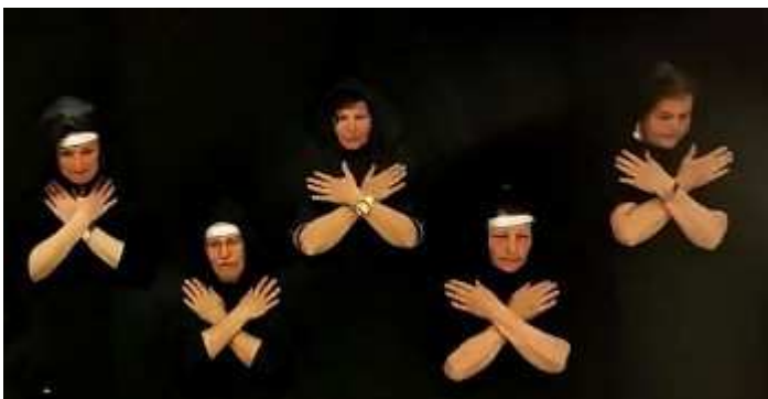
A második táncjelenetben végre erre is fény derül. A vendégek ütemes tapssal kísérik apácáinkat.