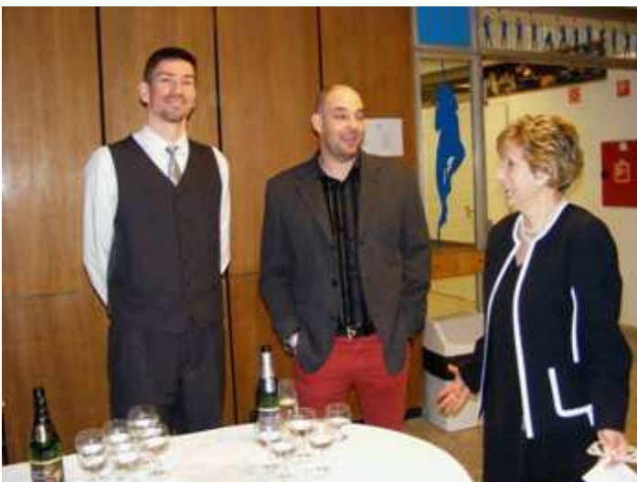
Belépő ital: Szárazat vagy édeset?