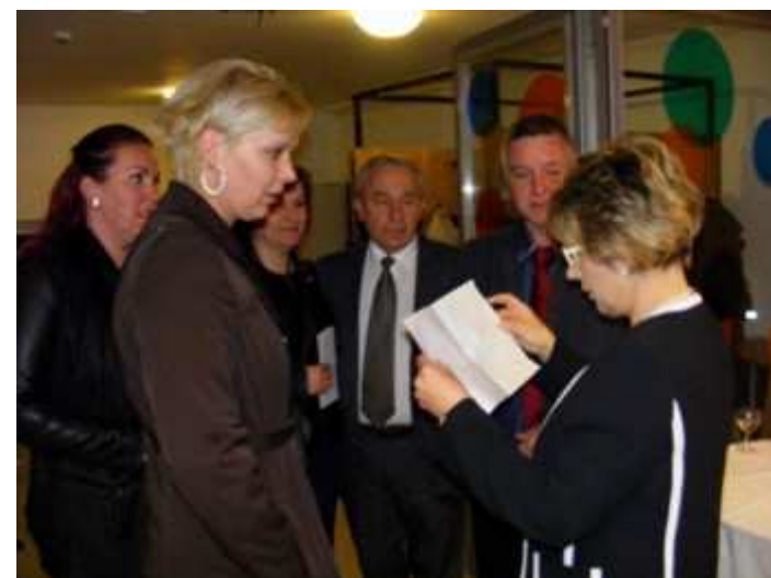
Van aki kicsit késve érkezik, de mindenkit vár a névre szóló hely