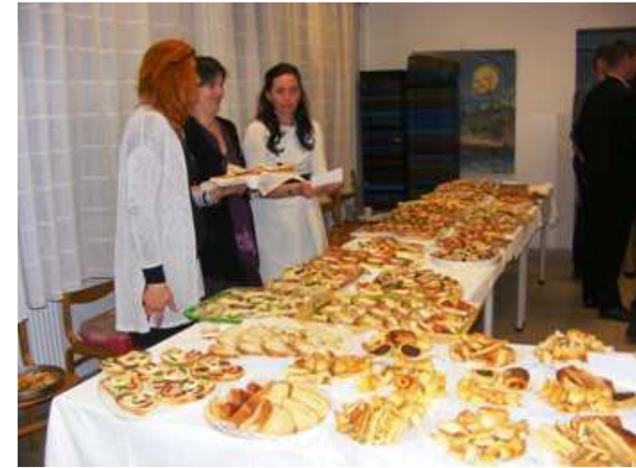
A büfében eközben sem áll meg az élet. Aki erőt akar meríteni, bőven talál finom falatokat.