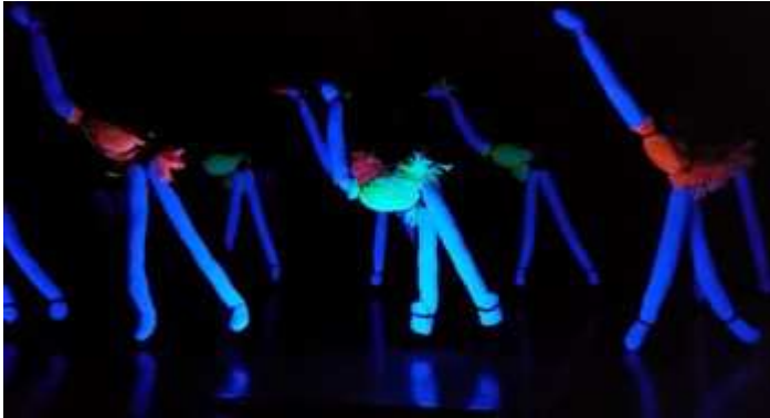
A koromsötétben felcsendül a zene. Az UV fényben végre meglátjuk a madarakat. DE vajon kik is ők?