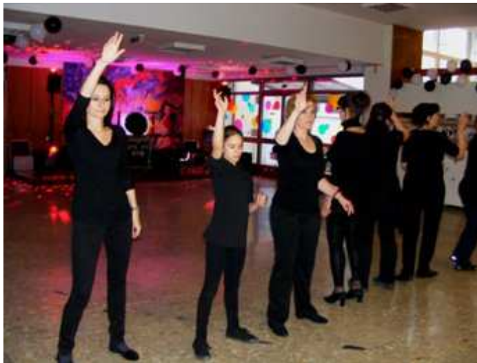
A tanári meglepetés-tánc főpróbája – Struccok