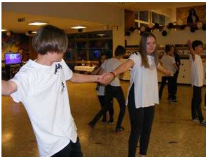
A 8.a feketén-fehéren bemutatja a DIK-napi táncát