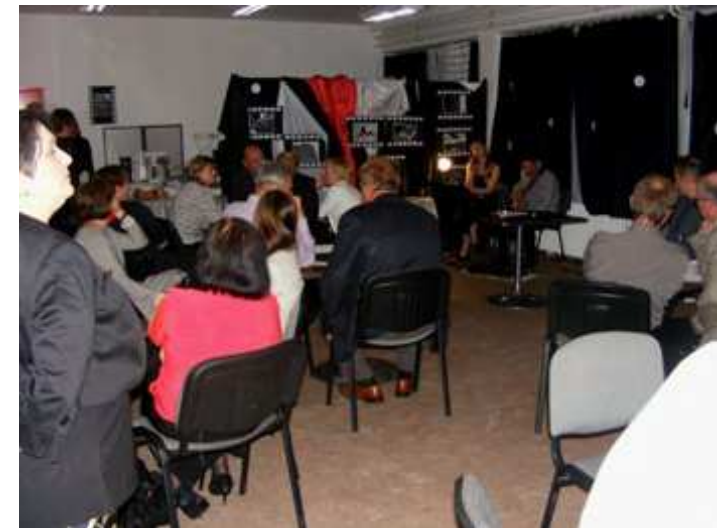
Sokan hallgatják a tehetséges fiatalokat.