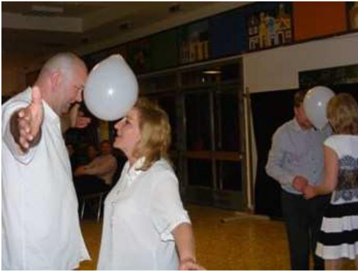
A feladatok egyre nehezebbek, de van aki győzi. Íme a győztes pár.