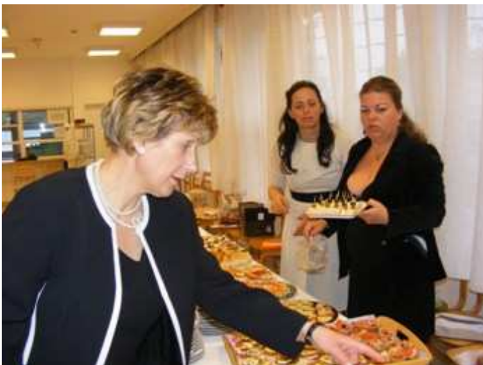
Utolsó simítások az 1.b szülőkkal