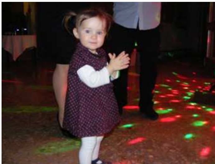
A legfiatalabb bálozónk kilóg a sorból.