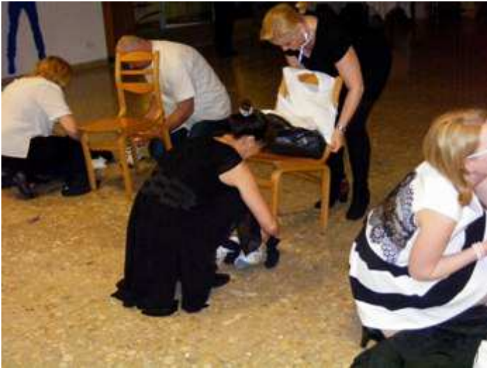
Az utolsó fordulóban a székeket kell bálhoz illő figyelemmel, precizitással felöltöztetni.