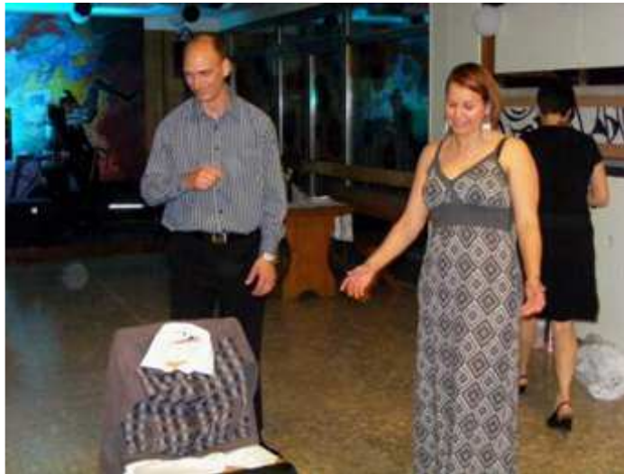
Íme egy mutatós fehérgalléros megoldás.