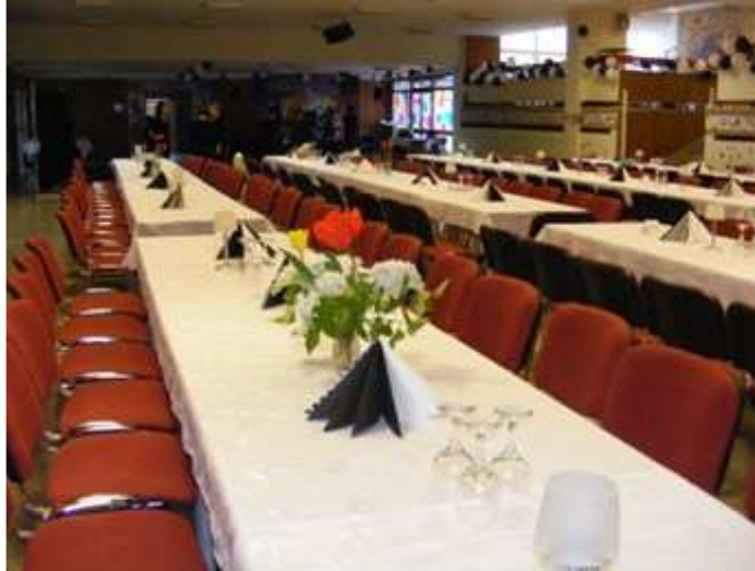
Feldíszített aula várja a vendégeket.