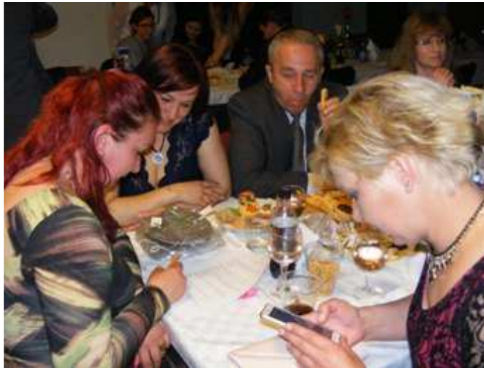
A talpraesettek internetes segítséghez folyamodnak.