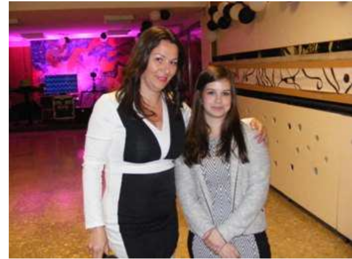
A Barcsay bálban nagyon értékesek a NEM NYERT szelvények. Mindjárt kezdődik a vigasz-húzás.