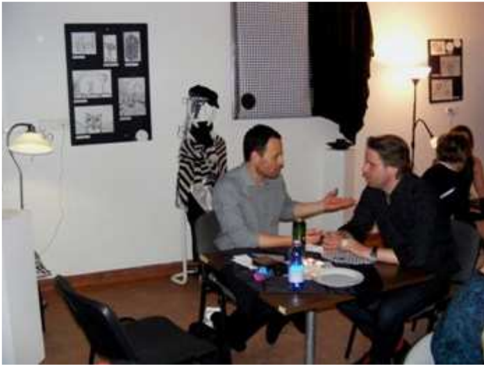
A különleges dekorációnak köszönhetően rá sem ismerni a nagytanárira.