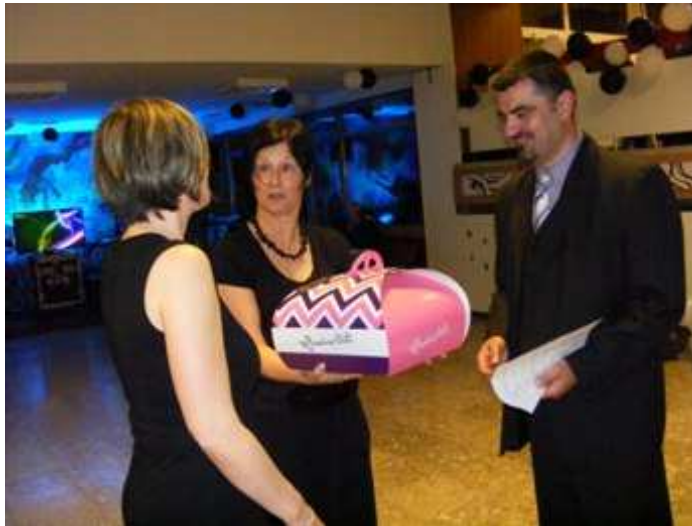
A kézműves tortát az a két csapat oszthatja el, aki külső segítség nélkül a legtöbb pontot szerezte.