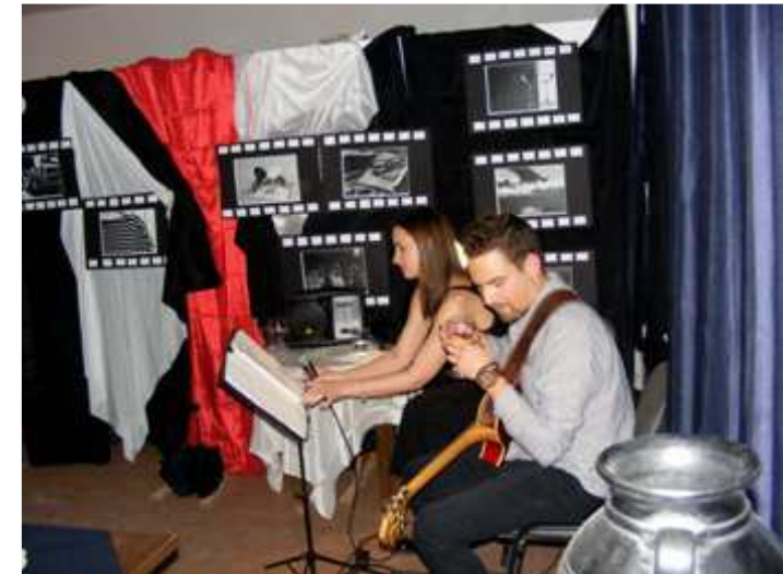
A kávézóban élőzene várja a vendégeket.