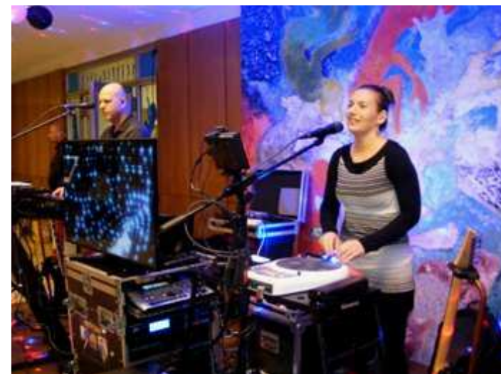
Rákezd a zenekar, várjuk a koromfekete estet.