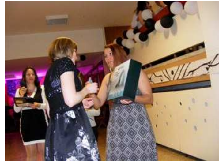
Ekkor kerülnek kisorsolásra a legértékesebb nyeremények, itt egy mágneses rezonancia gyűrű.