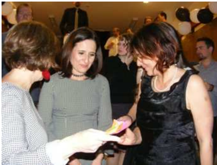
Senki sem szeretne színes tombolaszelvények nélkül maradni. A családoknak hála az idén is bővelkedtünk pompás tombola-tárgyakban.