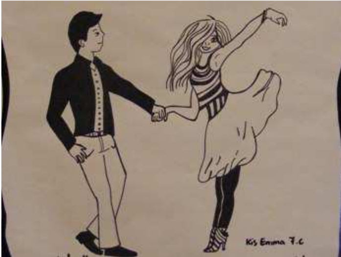
Barcsay Jótékonysági Bál 2017. április 22., a fekete-fehér jegyében