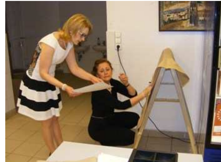
Árkalkuláció :mi mennyibe kerüljön a büfében?