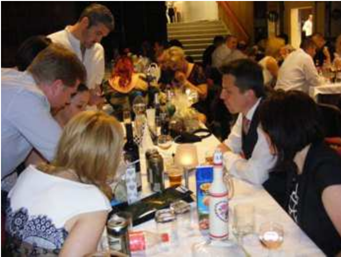
Kezdődik a játék. A spontán szerveződő csapatoknak totókérdésekre válaszolnak, a kérdések természetesen a fekete-fehér témát feszegetik.