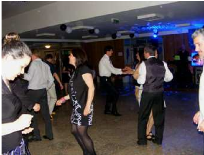
Fekete-fehérben ropjuk a táncot.